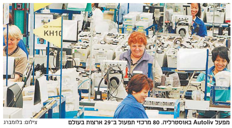
מפעל Autoliv באוסטרליה. 80 מרכזי תפעול ב-29 ארצות בעולם

מוצרי הבטיחות הפסיביים שמייצרת החברה כוללים כריות אוויר והגורות בטיחות. בין מוצרי האבטחה האקטיביים ישנן מערכות רדאר, מצלמות, מערכות בלימה מתוחכמות ועוד. מגזר זה הציג צמיחה זה מספר רבעונים ברציפות ועלה ביותר מ-50%. החברה מוכרת את מוצריה לחברות רבות של רכבי יוקרה, ובהן מרצדס, קרייזלר, יגואר, אלפא רומיאו, פולקסווגן, וולוו ועוד. מוצרי האבטחה האקטיביים תפסו 68% מסך מכירות החברה ברבעון