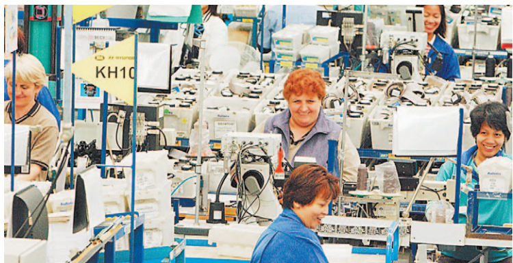
בפעל Autoliv באוסטרליה. 80 מרכזי תפעול ב-29 ארצות בעולם.

מוצרי הבטיחות הפסיביים שמייצרת החברה כוללים כריות אוויר והגורות בטיחות. בין מוצרי האבטחה האקטיביים ישנן מערכות רדאר, מצלמות, מערכות בלימה מתוחכמות ועוד. מגור זה הציג צמיחה זה מספר רבעונים ברציפות ועלה ביותר מ-50%. החברה מוכרת את מוצריה לחברות רבות של רכבי יוקרה, ובהן מרצדס, קרייזלר, יגואר, אלפא רומיאו, פולקסווגן, וולוו ועוד. מוצרי האבטחה האקטיביים תפסו 68% מסך מכירות החברה ברבעון